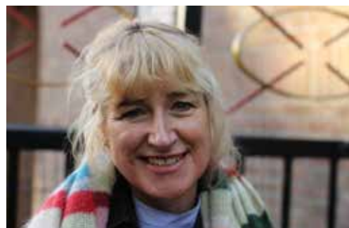
Zwanine, de creatieve duizendpoot van Kerk & Buurt Westerpark

De Terugblik verschijnt onder verantwoordelijkheid van het bestuur. Deze uitgave is mede mogelijk gemaakt door een bijdrage uit het fonds Bewonersinitiatieven.