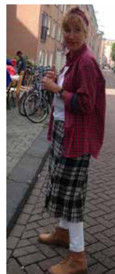
Zwanine in het Schots