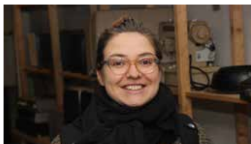
En Jette die met de lach van een milde zon de burenhulp in het licht weet te zetten.