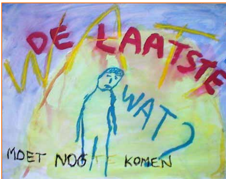
Mijn vader loopt van me weg, draait plotseling zijn hoofd om en zegt "Wat?" Hij leeft nog en zal dat waarschijnlijk nog wel eens doen.