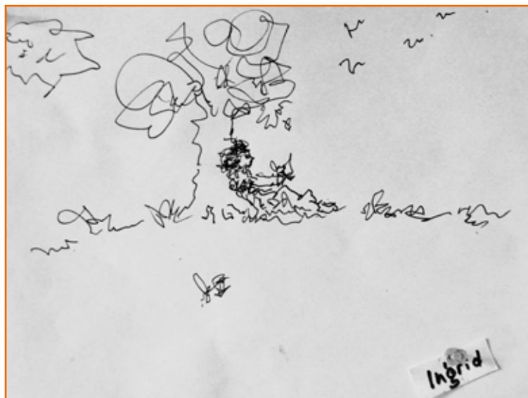
Een pentekening van Ingrid in een paar halen. “Want veel meer geduld kan ik niet altijd opbrengen.”