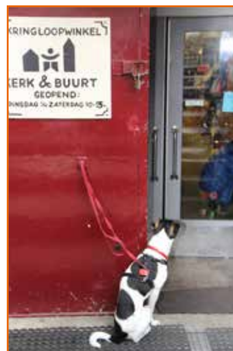
Interessant die kringloopwinkel