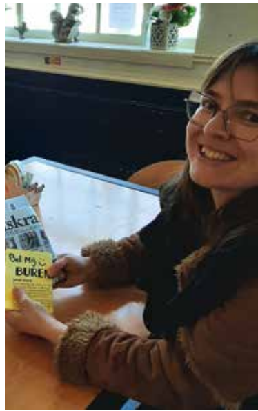
Lokale media steunt de buurt