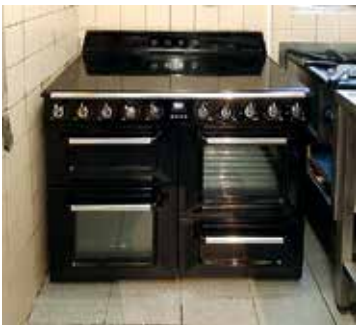
Van het gas af met het nieuwe inductiekooktoestel

De bezorg- en afhaalservice werd verplaatst naar De Koperen Knoop waar gekookt kon worden in de keuken van Samen Sterk Vrouwen West.