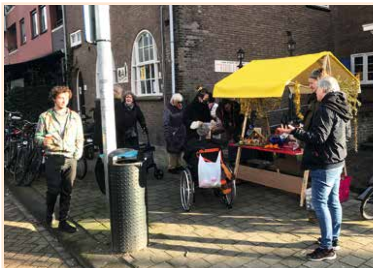
Een kraampje voor de Nassaukerk aan de De Wittenkade