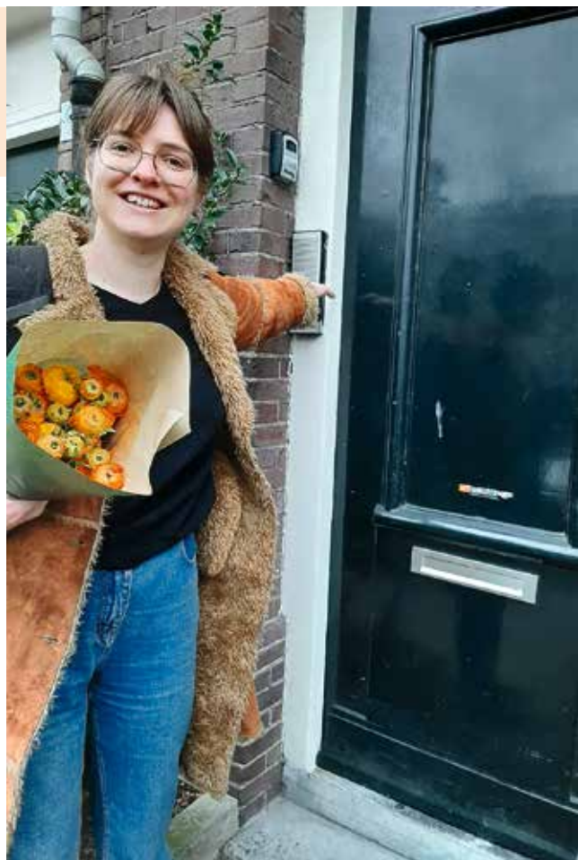
Jette belt aan met een bloemetje

Voor een geslaagde match tussen hulpvrager en vrijwilliger bij een hulpvraag bij Burenhulp zijn doorgaans drie contactmomenten nodig. Gaat het om een klusje