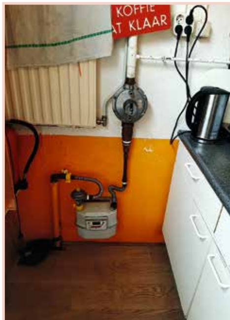
De oude keuken van Filah

De gemeente Amsterdam, het stadsdeel Westerpark, Combiwel, Buurtbudget, Inspiratieteam Westerpark, Fonds Franciscus, VSBfonds, Insinger stichting, Maatschappij van Welstand en de stichting Rotterdam.