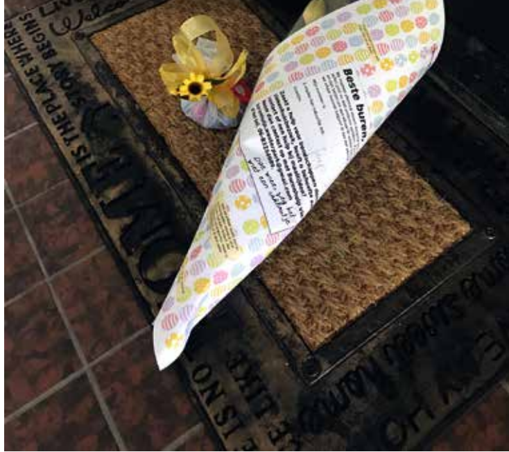
Een bloemetje met uitleg op de deurmat

Deurmat met uitleg op de deurmat. Een bloemetje met uitleg op de deurmat.