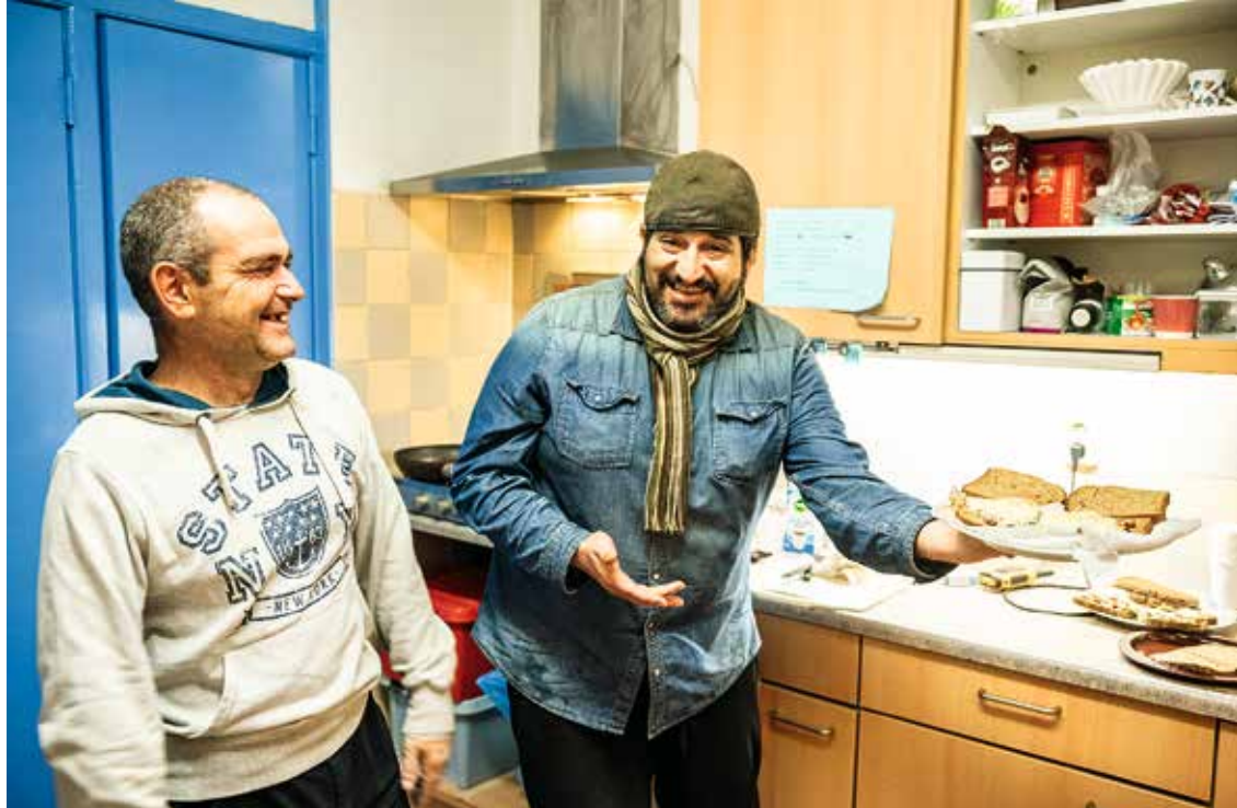
Inloop in De Schakel