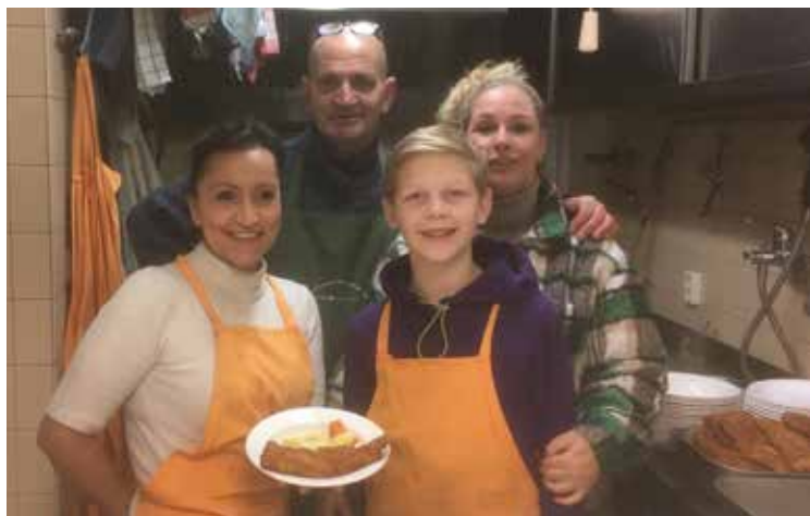
De kookgroep uit Spakenburg