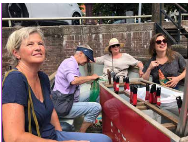
Uitje met de vrijwilligers van de inloop met de Plastic Whale door de grachten van Amsterdam

nodig een luisterend oor te zijn, te ondersteunen bij moeilijke telefoontjes, en zo nu en dan te helpen bij verzorgen van wonden, want het bestaan op straat eist zijn tol. Het is mooi dat we dan deze plek kunnen bieden.