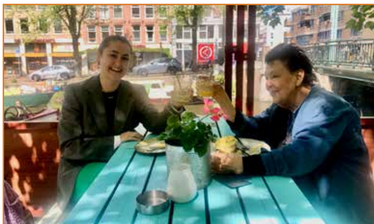
Suus (links): "We doen wekelijks een boodschap. Soms drinken we koffie op een terrasje. Ik merk dat het sociaal contact haar goed doet."

Samen met Buurthulp West organiseren wij zeven bijeenkomsten per jaar. De bijeenkomsten gaan in op de ervaringen