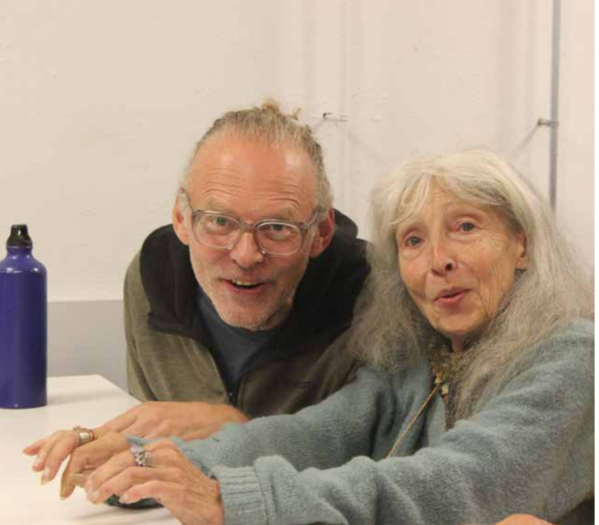
Twee bezoekers van Filah