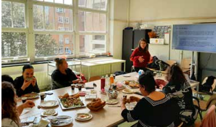
Voorlichtingslunch over de sociale basis