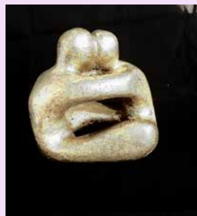
De Grote Liefde

Eén van de bezoekers van de inloop wil niet zelf op de foto. Toch heeft hij een boodschap die hij kwijt wil, vastgelegd in een door hem gemaakt kunstwerk. Of we dat in de Terugblik willen plaatsen. De Terugblik zal hij dan trots uitdelen aan zijn vrienden.