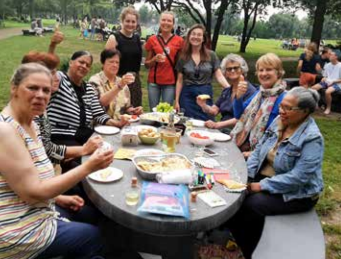
Vrijwilligersuitje in het Westerpark