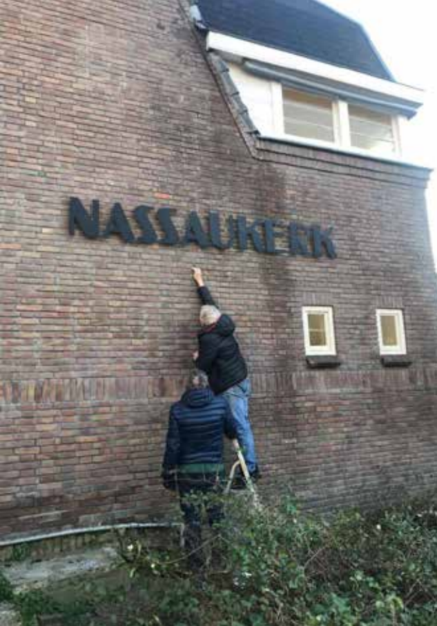
Kerk en Buurt Westerpark speelt een belangrijke rol als huurder en gebruiker van het kerkgebouw