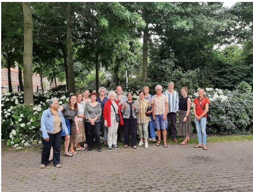
Een aantal vrijwilligers van Burenhulp tijdens een uitje