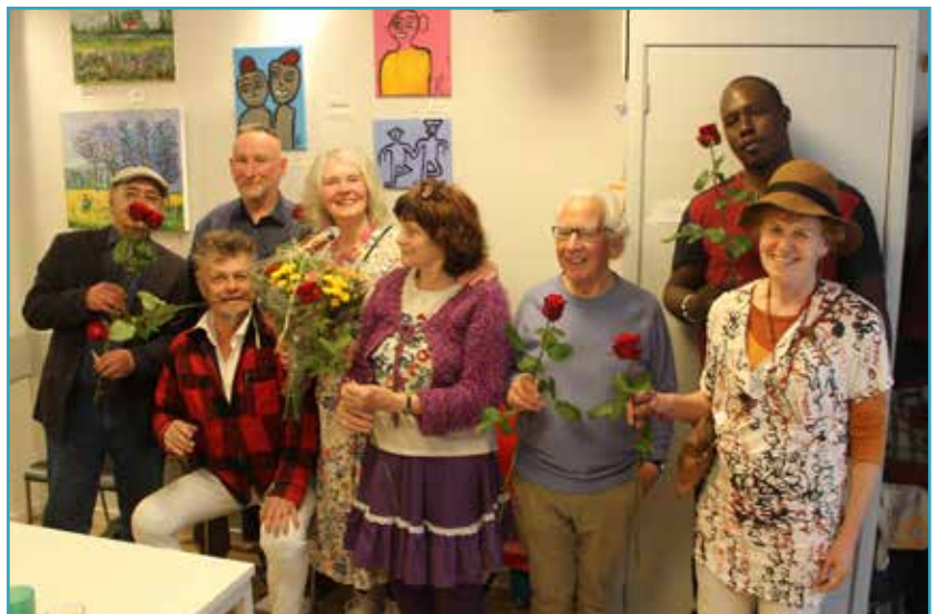
Ook de schilderclub van Carla heeft dit jaar geëxposeerd in Filah