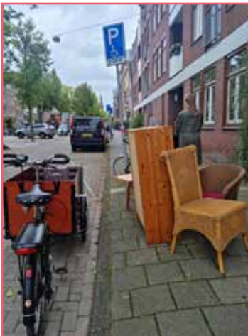
Met de nieuwe elektrische bakfiets is het goed spullen ophalen

spontaan langskomen. Steeds meer jonge mensen weten onze winkel te vinden. Ook jonge mensen zoeken naar verbinding met buurtgenoten. De gentrificatie is dus geen reden voor ons om te schakelen naar wij- en zij-denken. We willen dit juist gebruiken om mee te