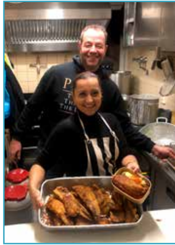
Het uitdelen van de maaltijd

In de tuin staat een professionele visfriteuse. Ook in 2023 is daar weer flink veel vis in gebakken. Een erg geliefd maaltje in Filah. Deze visfriteuse staat daar al meer dan 10 jaar en is toe aan vervanging. Dankzij hulp van donateurs hopen we binnenkort een nieuwe pan te kunnen aanschaffen.