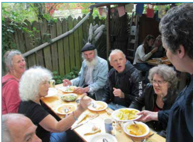
Bij warm weer kan er in de tuin worden gegeten