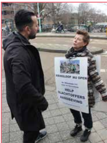
Zaterdag open voor een goed doel

hele buurt. Er is voor 2024 een verbouwing gepland waardoor het winkeloppervlak zal toenemen. Hierdoor ontstaan er kansen voor ons om de ruimte opnieuw in te delen met een blik gericht op de ( nabije) toekomst.'