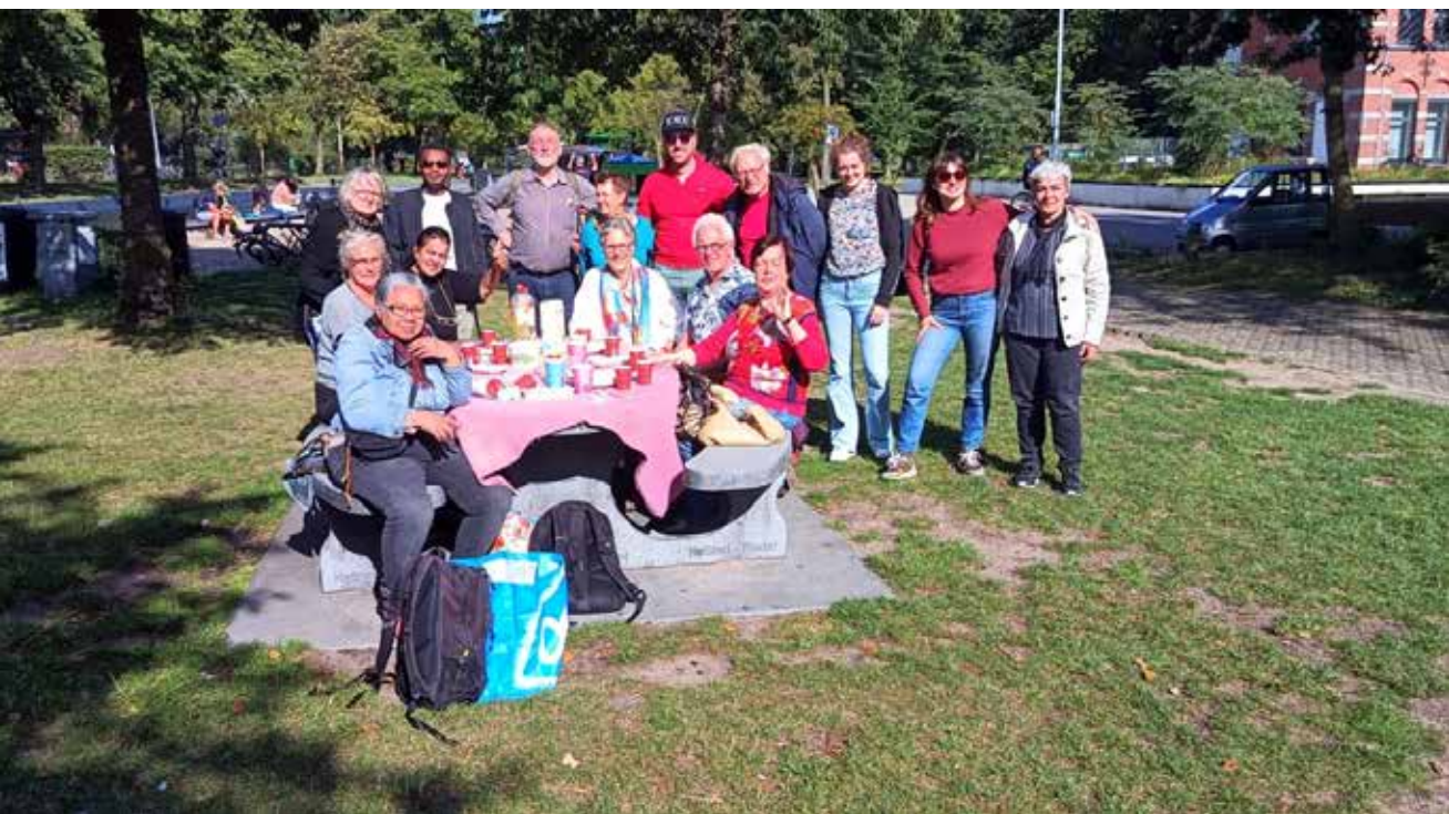
Buurmaatjes bij elkaar in het Westerpark

Bij Burenhulp Westerpark kunnen buurtbewoners terecht met praktische vragen zoals hulp bij boodschappen en klusjes in en om het huis. Ook krijgt ze steeds meer vragen voor een maatje voor gezelschap: samen wandelen, een museumbezoek of gewoon een praatje maken.