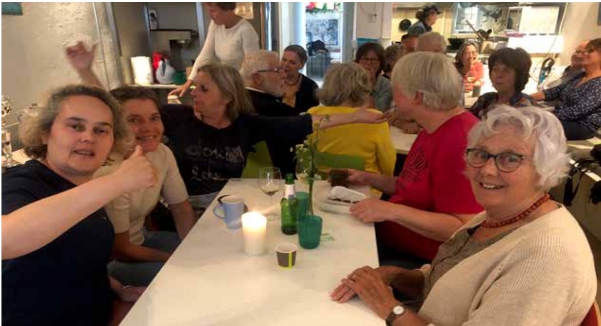
Tijdens de quiz van het jaarlijkse vrijwilligersdiner