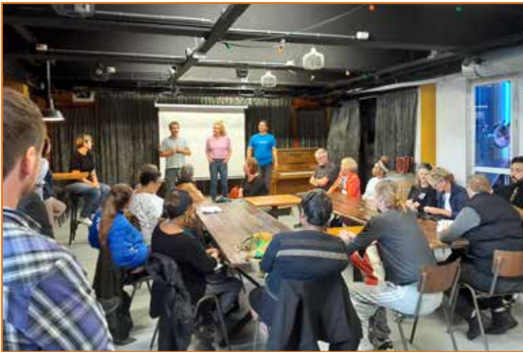
Tijdens een wijktafel Westerpark op bezoek bij dagbesteding, locatie Breugem