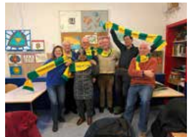
Burenhulpers hielpen het Energieteam als fixers en energiecoach

zorgorganisaties uit stadsdeel Amsterdam West aangesloten, onder andere Burennetwerk, Voor Elkaar In West, Humanitas en De Regenbooggroep.