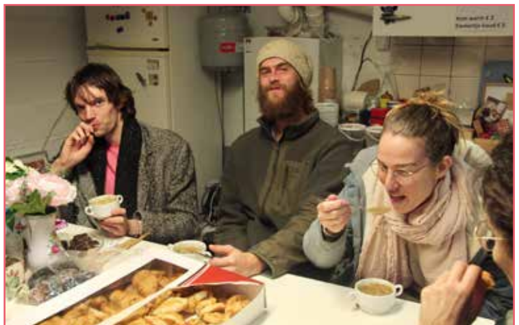
Bezoekers van de kerstmarkt genieten van de linzensoep