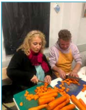
Snijhulpen Lily en Herwin