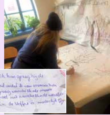
Oefening teamdag over 'welke impact maken we?': het maken van een Rich Picture

tijdens het kookproject. Er is tijd en aandacht nodig om de impact te zien en te maken. Het helpt om meer uit het werk te halen. Als je meer ziet kan er ook meer 'geogst worden' en dat