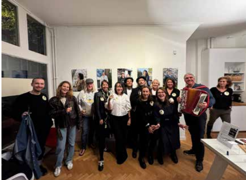
Samenwerking binnen platform informele zorg leidt er toe dat de expositie van de foto's van buurtgenoten van (T)huis in de Staats ook in de bibliotheek komt te hangen. Hier de feestelijke opening.

WODM is een verdieping van Burenhulp. Onze missie is om mensen langer plezierig thuis te laten wonen en eenzaamheid tegen te gaan door mensen te stimuleren om mee te