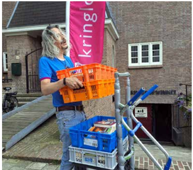
Boeken worden weggebracht naar de weggeefkastjes

Meer klanten betekent ook meer inbreng. Helaas kan niet alles de winkel in. Wij