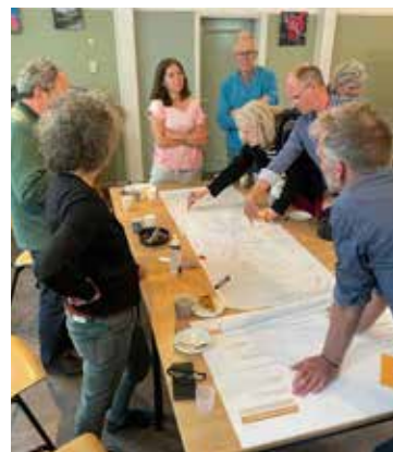
Een deel van de klankbordgroep aan het werk

Ieder stukje is uniek, maar zonder de andere stukjes eromheen is het een merkwaardige grillig gevormd ding, met uitsteeksels en holtes. Juist de kracht hoe we allemaal aan elkaar haken, ieder met zijn talenten en zijn makkes, maakt dat we jaar in jaar uit aan kracht winnen. Sterk zijn zodat nieuwe mensen weer kunnen aanhaken.'