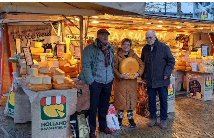
De kaasmarkt kraam

Tot 6 februari 2026 exposeren de schilders in Filah hun prachtige