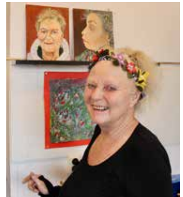
Grada met een paar van haar geschilderde portretten