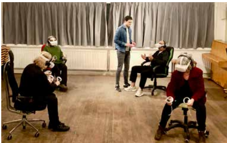
Maatjesavond waarin men via Virtual Reality kon ervaren wat het is te leven met dementie

De bijzondere band tussen de hulpvrager en maatjes is op beeld vastgelegd en is komend voorjaar (januari en februari 2025) te zien in een expositie in de OBA. Een eerste voorproefje is te zien op de omslag van deze Terugblik.