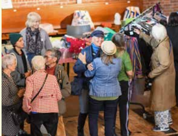
Bezoekers bij West Kleed Aan tijdens burendag