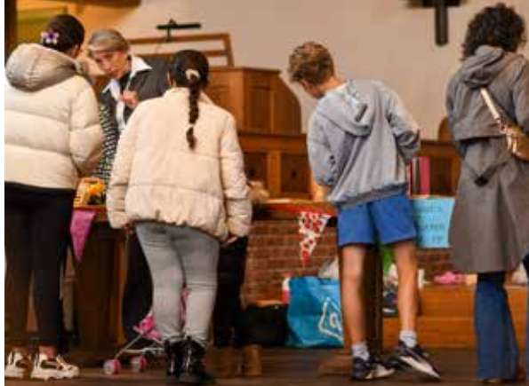
Kinderen komen bingoprijs halen tijdens Burendag