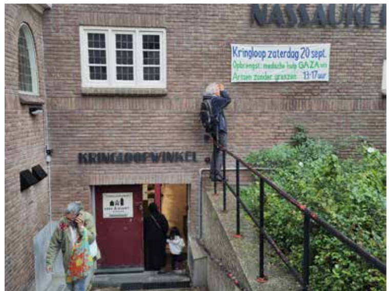
Zaterdagopening voor Artsen Zonder Grenzen

de kast gehaald om de buurt te verbinden in zo'n actie en die tot een succes te maken. De klanten kwamen soms van ver en doneerden gul. Voor GAZA werd er 2.167,- opgehaald bestemd voor medische hulp via Artsen zonder grenzen.