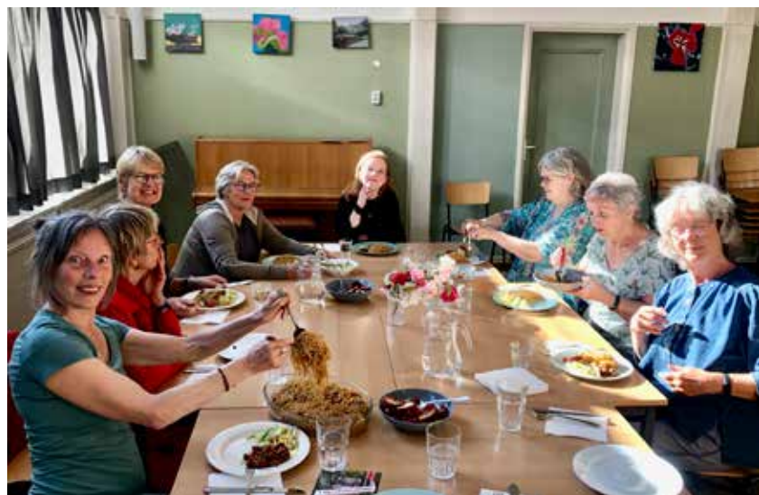
De maatjesavonden beginnen altijd met samen eten

we een vaartochtje door de grachten. Met veel succes! Voor sommige buurtgenoten was het lang geleden dat ze eropuit waren geweest en vereiste het alle hens aan dek om hen aan boord te krijgen.