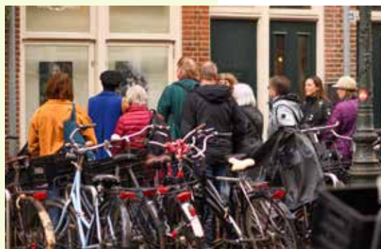
Portretten bij Kunsttraject tijdens Burendag